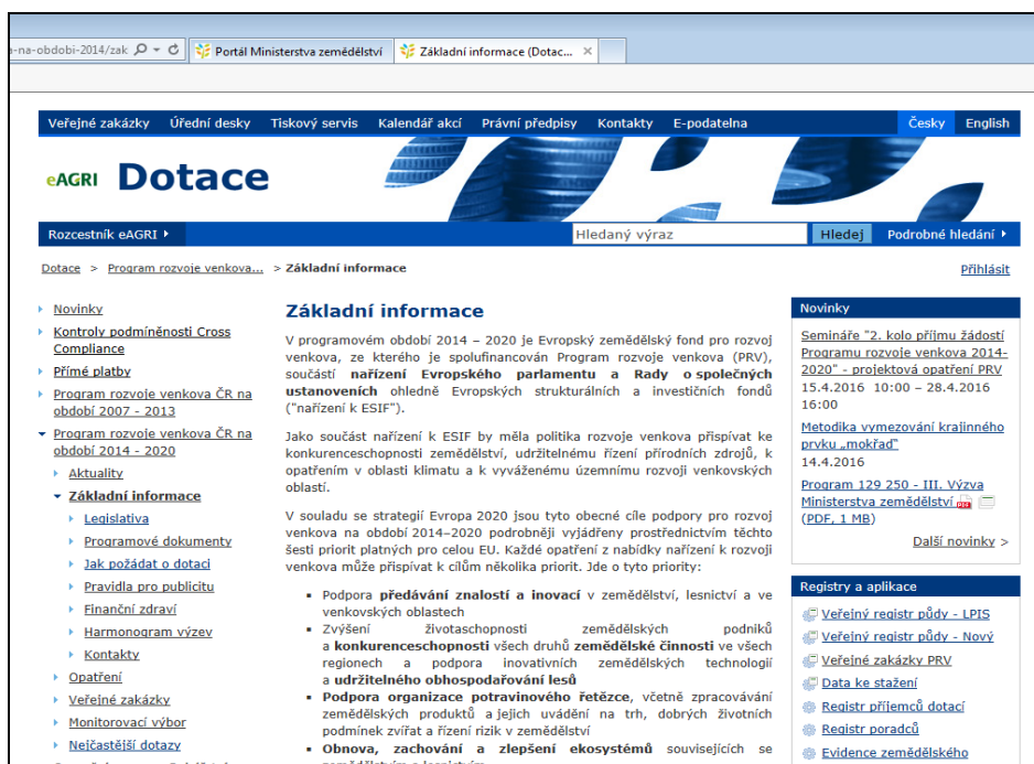
Obr. 1: Náhled na základní strukturu webových stránek eagri.cz/prv

Na výše uvedených internetových stránkách najde žadatel všechny informace potřebné pro podání žádosti o dotaci, ať se již jedná o přehledné popisy postupů administrace, legislativní požadavky, vlastní Pravidla pro žadatele a nařízení vlády včetně metodik pro environmentální opatření PRV nebo příručky pro specifické oblasti administrace. Informace o podmínkách administrace včetně Pravidel pro žadatele a dalších dokumentů jsou také k dispozici na internetových stránkách platební agentury www.szif.cz .